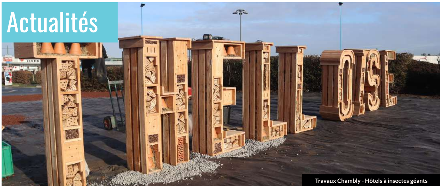
Travaux Chambly - Hôtels à insectes géants