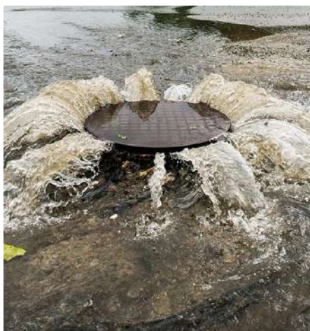
Les eaux de pluie évacuées dans les réseaux d'eaux usées peuvent provoquer des débordements

Le raccordement d'eaux pluviales dans les réseaux d'assainissement eaux usées est interdit (sauf exception) car celles-ci perturbent le fonctionnement des installations de transport et de traitement de ces eaux usées.